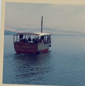
Het meer van Galilea