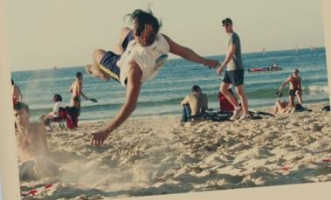
Strand in Tel Aviv

"Een reis om nooit te vergeten. Dit is meer dan een toeristische reis. Ontdek wat de Bijbel vandaag de dag te zeggen heeft over Israël en wat Gods beloften zijn voor het joodse volk. En wat dat te maken heeft met jou.."