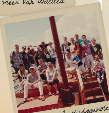
Samen met leeftijdsgenoten Israël ontdekken!