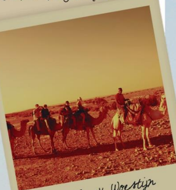
In de Negev Woestijn